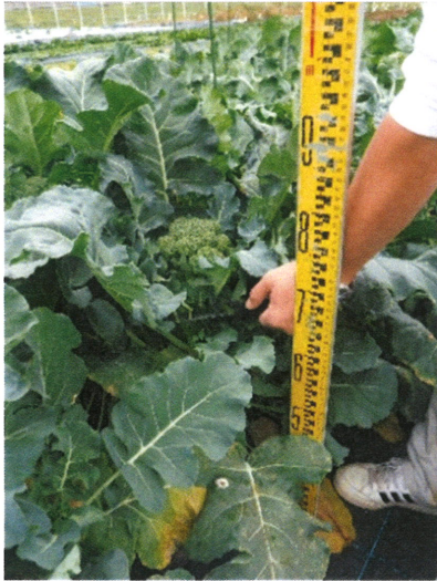
花蕾位置高く収穫容易